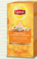
Infusion Camomille Saveur Miel