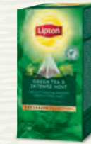
Thé Vert Menthe Intense