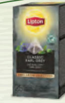
Thé Earl Grey