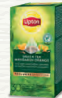
Thé Vert Mandarine Orange