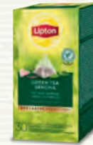
Thé Vert Sencha