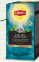
Thé English Breakfast