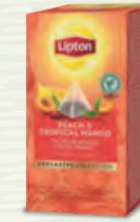
Thé Pêche Mangue