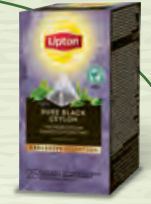
Thé Noir Ceylan