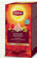
Infusion African Rooibos