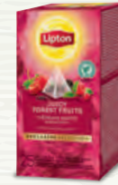
Thé Fruits Rouges