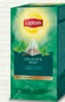
Infusion Menthe Douce