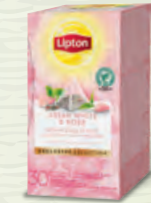
Thé Blanc Argent d'Asie et Rose